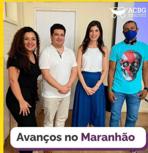
Avanços no Maranhão